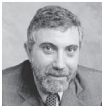
PAUL KRUGMAN © 2012 New York Times

The French are revolting. The Greeks, too. And it's about time.